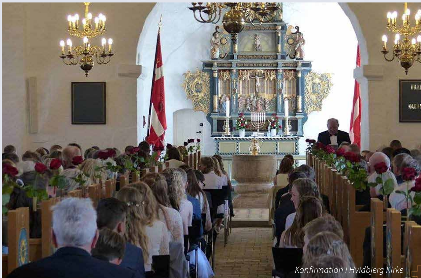
Konfirmation i Hvidbjerg Kirke

Egentlig lyder dét til os alle, hver gang vi mødes i Guds hus, og på den måde er det rigtigt, det som H.C. Andersen skriver i et eventyr, at vi er alle er konfirmander for Vor Herre. Alle har vi brug for igen og igen at blive mindet om, at vi er Guds børn, og må stole på, at selv om vi måske for længst er trådt ind i de voksnes rækker, så lyder det stadig til os fra vor Far i Himlen: "Du er mit barn og intet kan skille dig fra min kærlighed".