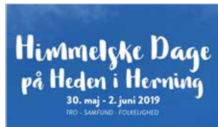
PASTORATSUDFLUGT TIL HIMMELSKE DAGE