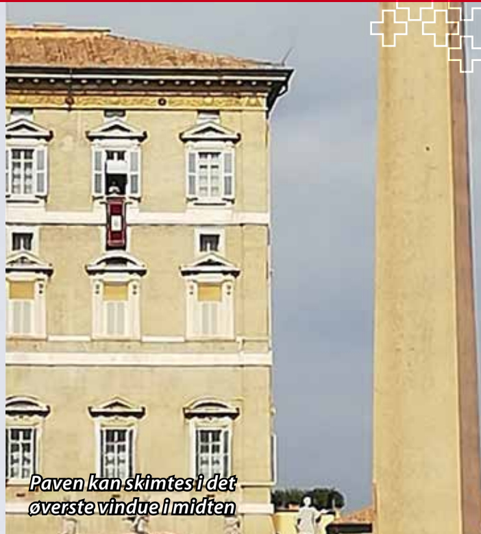
Paven kan skimtes i det øverste vindue i midten

Efter fem dage og over 100 kilometers vandren rundt må vi bare erklære, at Rom er meget storslået og gennemsyret af historiens vingesus. Det er i sandhed Den Evige Stad!