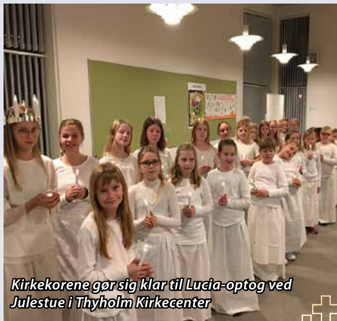
Kirkekorene gør sig klar til Lucia-optog ved Julestue i Thyholm Kirkecenter