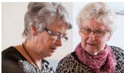
MENIGHEDSPLEJEN. HVAD ER DET?