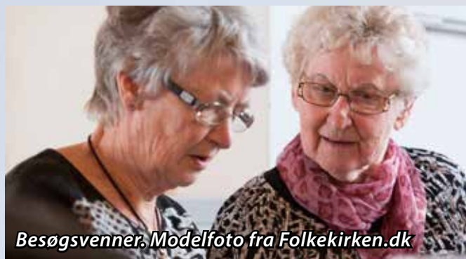
Besøgsvenner. Modelfoto fra Folkekirken.dk

Lige nu har vi 3 disponible besøgsvenner, og vi vil gerne have mange flere.