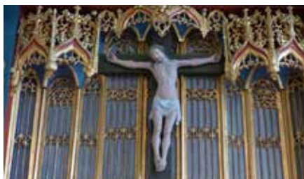
EN FORARGELSE FOR JØDER EN DÅRSKAB FOR HEDNINGER

N.F.S. Grundtvig 1817 og 1835 Den danske salmebog 236