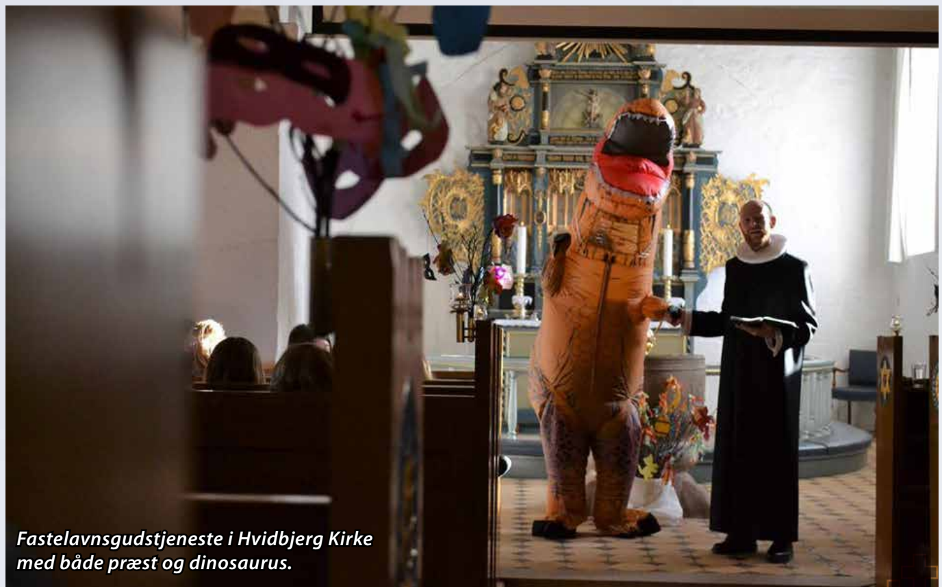
Fastelavngudstjeneste i Hvidbjerg Kirke med både præst og dinosaur.