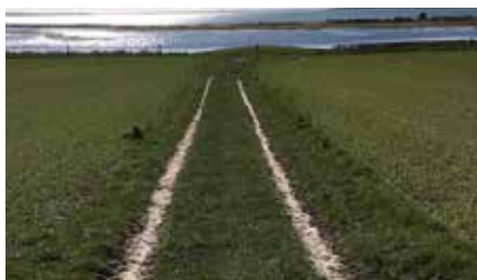
NÅR NOGEN HOLDER HÅNDEN UNDER OS