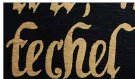
SKRIFTEN PÅ VÆGGEN