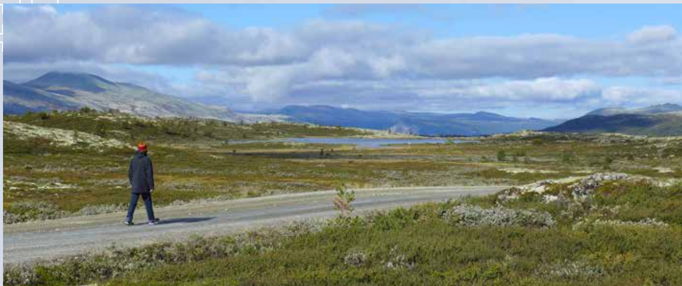
Danske Søren i Rondane, Norge.