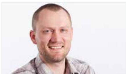
FOREDRAG: ET BUD PÅ FORNYELSE I FOLKEKIRKEN

“Muren er sin egen skrift” af Jørgen Gustava Brandt 1986