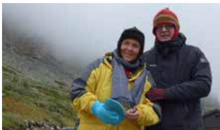
EN HILSEN FRA MIDT-NORGE